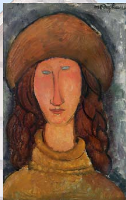
Amadeo Modigliani "Jeanne Hebuterne" 1918 Musée d'Art moderne, collections nationales Pierre et Denise Lévy