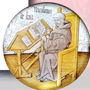
AL - Troyes La Champagne Tourisme

Forfait 2026 disponible tous les jours sauf le lundi