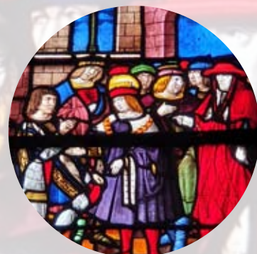
AL - Troyes La Champagne Tourisme