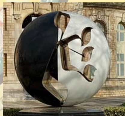
AG - Troyes La Champagne Tourisme

Cette promenade dans le coeur historique de Troyes évoque la vie de Rabbi Salomon fils d'Isaac, dit Rachi, célèbre commentateur de la Bible et du Talmud, né à Troyes en 1040. Le guide retracera son parcours exceptionnel et son influence durable dans le monde juif. En chemin, vous découvrirez également l'histoire de la communauté juive médiévale de Troyes et son rôle dans la vie de la cité. Une plongée passionnante dans l'histoire intellectuelle et religieuse du Moyen-âge.