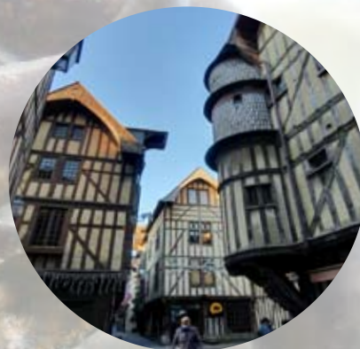
© AR - Troyes La Champagne