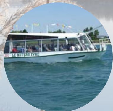
Le bateau ivre / Mesnil St Père