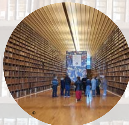
AR - Troyes La Champagne Tourisme