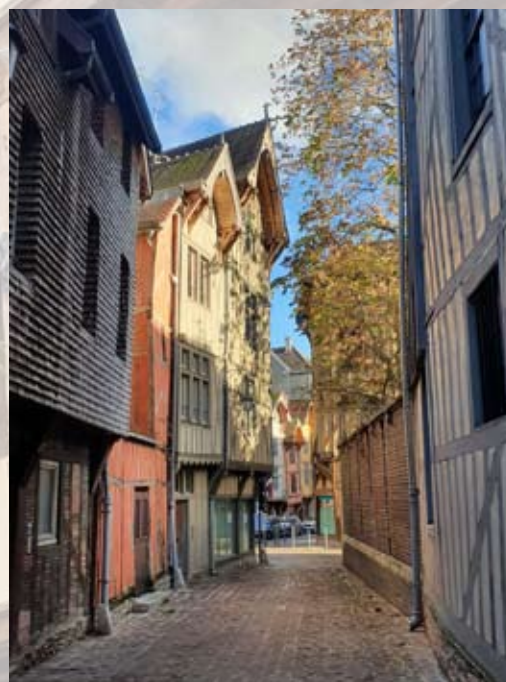
AR - Troyes La Champagne

* Choix donné entre l'andouillette de Troyes et d'autres plats