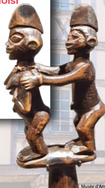
Musée d'Art moderne, collections nationales Pierre et Denise Lévy

Forfait disponible tous les jours sauf le lundi