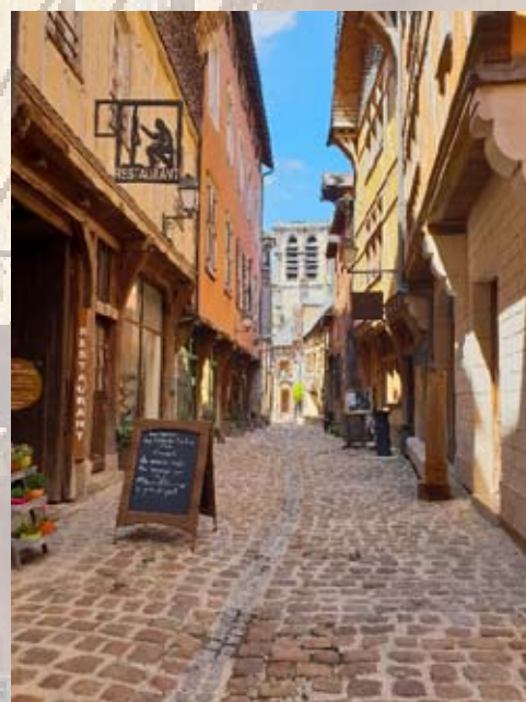
AL - Troyes La Champagne Tourisme

Musée St loup (Beaux-arts, archéologie et histoire naturelle) fermé pour travaux en 2026