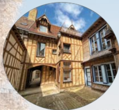
AR - Troyes La Champagne