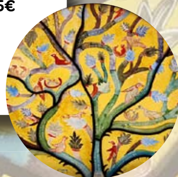
AR - Troyes La Champagne Tourisme

Forfait 2026 disponible tous les jours sauf le samedi et selon la disponibilité de la Maison Rachi