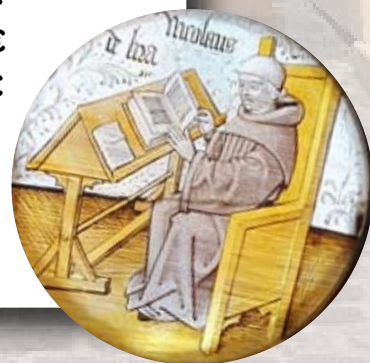
AR - Troyes La Champagne Tourisme

Forfait 2026 disponible selon les jours d'ouverture hebdomadaire des musées.