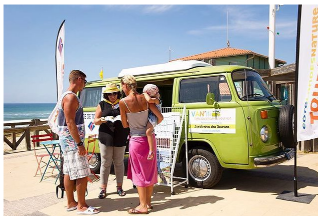
Le Van'iti de Côte Landes Nature

Il est apparu qu'un accueil mobile doit :